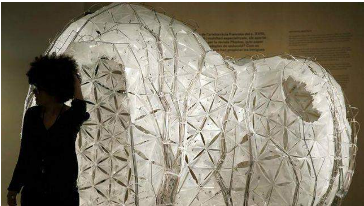
El CCCB explora el poder de la arquitectura como motor de deseo sexual

Refugios libertinos, comunidades utópicas gobernadas por las pasiones o un centro multimedia de entretenimientos sexuales son algunos de los espacios creados o imaginados para potenciar el sexo que se recogen en la exposición del CCCB sobre arquitectura y sexualidad.