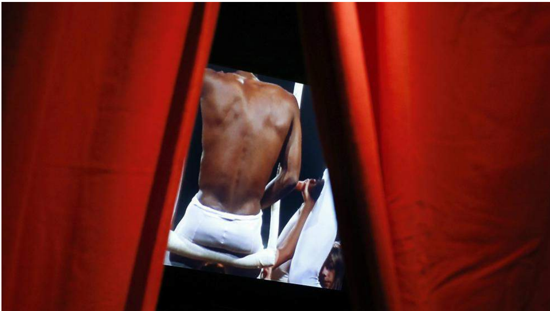
Imagen de una de las piezas de la exposición "1.000 m 2 de deseo. Arquitectura y sexualidad" del CCCB de Barcelona.

EP, Barcelona 25/10/2016 14:02 Actualizado a 25/10/2016 18:17