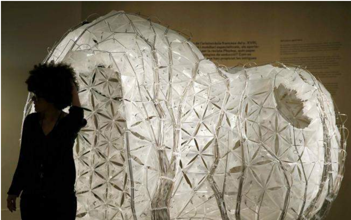
Una mujer observa una pieza de la exposición '1.000 m2 de deseo. Arquitectura y sexualidad' del CCCB.

Las utopías sexuales del siglo XVIII de Claude-Nicolas Ledoux, Restif de La Bretonne y Charles Fourier abren el recorrido con sus propuestas radicales con proyectos radicales como el templo del placer de Ledoux, y los espacios para orgías eróticas y gastronómicas de Fourier.