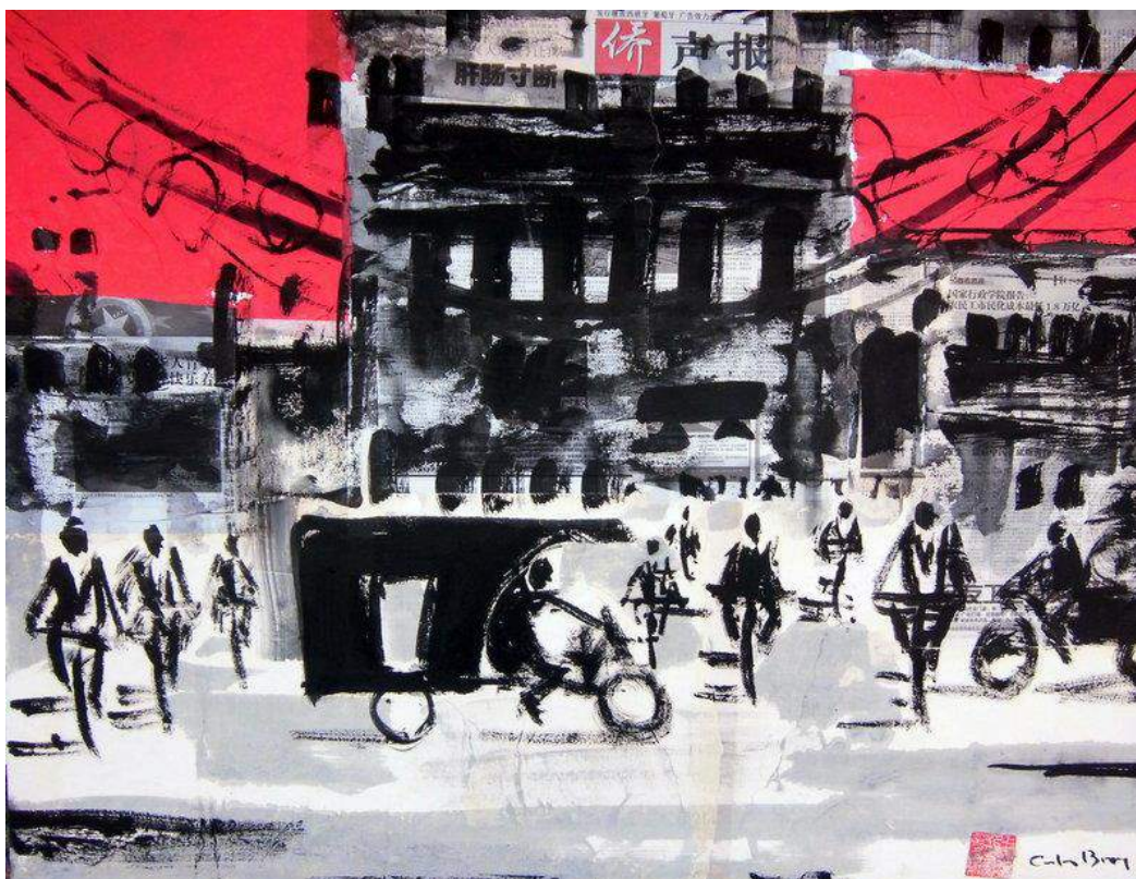
L'obra titulada 'Hutong', de Carles Bros CASTELL-PLATJA D'ARO.

La Masia Bas de Platja d'Aro exposa 'Testimoni artístic', una mostra col·lectiva d'una trentena d'artistes que han exposat al municipi entre els anys 2011 i el 2018